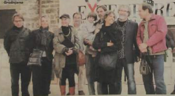
Uspomene iz Grožnjana

Ex tempore je uspješno okončan. Nekoliko pijukova koji su se srebrili na Grožnjan nije uspjelo pokvariti manifestaciju čiji su suorganizatori bili ZT i Općina Grožnjan te Vijeće talijanske nacionalne manjine Republike Hrvatske. Osim slikarskog dijela, program je obilježio drugim sadržajima u organizaciji općinske uprave, poput degustacije crnih vina Bužetne, izložbama bijelog tartufa i glijiva te nastupima nekoliko glazbenih skupina.