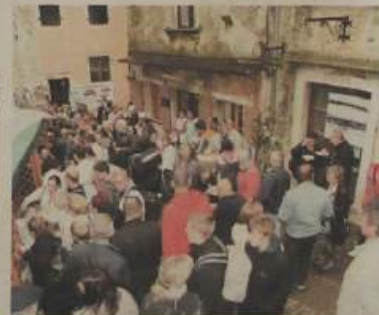
Niti kiša nije spriječila posjetitelje da pohode Grožnjan