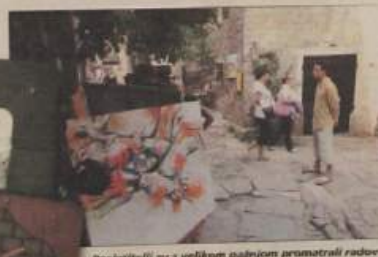
Posjetitelji su s velikom pažnjom promatrali radove