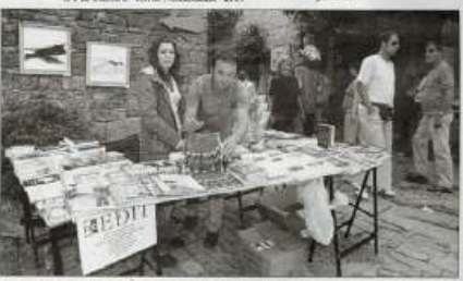
Immancabili all'Ex Tempore di Grisignana le pubblicizzatori della casa editrice ELYT di Trieste

Patrimonio naturale che continua a incantare