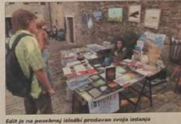
Edit je na posebnoj izložbi prodavao svoja izdanja