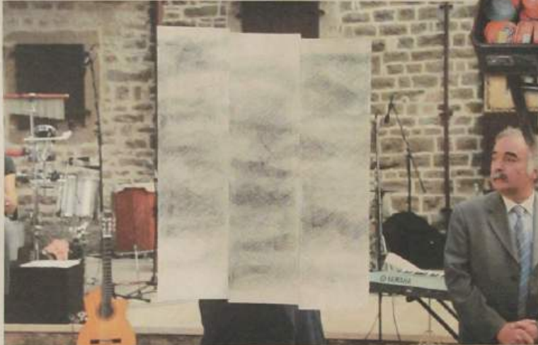
Prvonagrađena slika "Crne šare na bijeloj podlozi"

Sponzor su osigurali još tri nagrade od po 1.000 eura, koje su dobili Nicola Tomasi iz Gorizije za rad "Profondi legami", zatim Jasna Škarija iz Bakra koja se predstavila radom "Bez naziva" i Aleksandar Garbin iz Rovinja za sliku "Istra", jedinu koja je tematski bila povezana s uspomenom na književnika Fulvija Tomazzu. Naime, ovo izdanje ex tempore bilo je posvećeno upomeni na tog poznatog pisca ovog podnečja. S obzirom na kvalitetu rada i radi poticanja sudjelovanja autora koji se