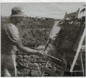
Il paesaggio triestino, inconfondibile fonte d'ispirazione per i pittori