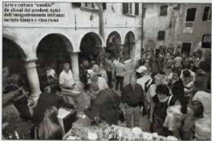
SERVIZIO DI PATRIZIA VENUCCI MERDÈO

GRISIGNANA - È stata una gran kermesse della pittura, della cultura e del buonumore, la XVI edizione dell'Ex Tempore di Grisignana, tradizionale manifestazione di pittura organizzata da Trieste, Comune e Comunità degli Italiani di Grisignana, con il contributo del Ministero degli Affari Esteri, Italiano e della Regione Autonoma Friuli Venezia Giulia, l'edizione 2009 è stata dedicata alle scritte litografiche: Trieste (1917-1945) - Trieste (1989), nel chiaro riconoscimento della sua occupazione.