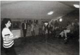
L'inaugurazione della mostra dei lavori presentati al Concorso d'Arte e di Cultura "Isola Nobile" 2009

Considerate uno degli avvenimenti culturali di maggior rilievo e visto della Comunità Nazionale Italiana in Slovenia e in Slovenia, l'evento nel corso degli anni è diventato un punto di riferimento sia per gli artisti connotati sia per altri autori provenienti dalla Trieste, dalla Slovenia e dall'Italia, in primo luogo, ma, come si è rivelato nelle precedenti edizioni, anche da altre parti d'Italia e del mondo. Ancora una volta la cittadina di San Vito, Medana e Ciconio, in questa piccola Montagna, nel corso della ventunesima kermesse, ha accolto nel suo luminoso grande salotto all'avento d'arte, su gran