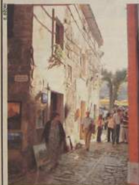
Ex tempore na ulicama Grožnjana

Grožnjanski Ex tempore, koj organiziraju Talijanska unija iz Rijeka, Istarsko Narodno sveučilište, Općina Grožnjani i ovdajšnja Zajednica Talijana, i u ovom 12. izdanju se povodi kao jedna od značajnijih slikarskih manifestacija u Istri. Osim što je okupio 255 autora iz Hrvatske, Italije i Slovenije, koji su raznolikom tehnikom izradili 414 radova na temu Grožnjana i istarskog kraja, do sada najmnogobrojnija publika mogla je tijekom nekoliko dana trajanja te manifestacije uživati u raznolikom programu. Prvi je put organizirana smotra rokarnih skupina, antiočijom i izložbom »Istria Nobilitas 2004« predstavljen je kulturno-umjetničko stvaralaštvo pripadnika talijanske nacionalne zajednice uz glazbu trija Saltin koji izvodi originalnu tradicionalnu glazbu, a održana je i izložba crvenih vina